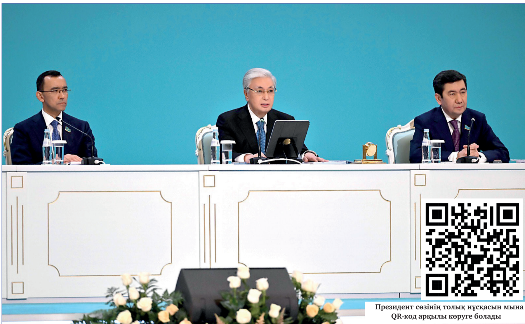
Президент сөзінің толық нұсқасын мына QR-код арқылы көруге болады

Күні кеше өткен барлық деңгейдегі мәслихат депутаттарының III республикалық форумында президент Қасым-Жомарт Тоқаев жергілікті басқару жүйесіне қатысты маңызды мәселелерді ашық айтты. Бұл сөз жай жиынға арналған баяндамадан гөрі аймақтардағы билік құрылымдарына қойылған нақты талаптар жиынтығы іспетті болды.